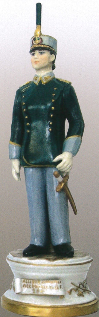
56 F - Allievo ufficiale Accademia Guardia di Finanza - 2011 (donna)