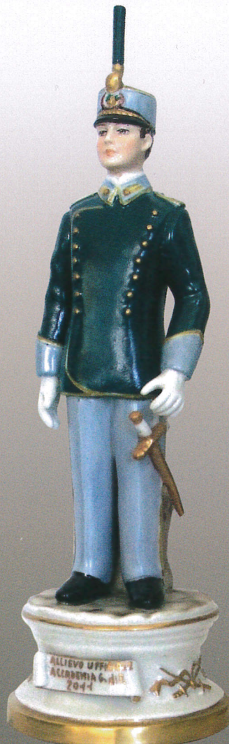
56 M - Allievo ufficiale Accademia Guardia di Finanza - 2011 (uomo)