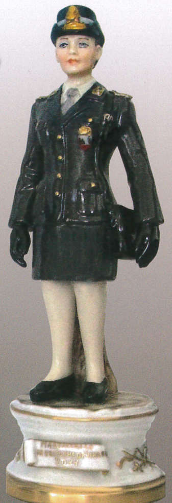
57 - Maresciallo in uniforme ordinaria - 2011